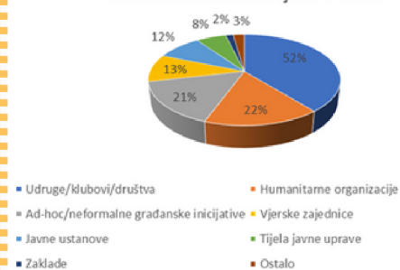
U periodu od 2020. - 2022. građani Hrvatske volonterski su bili uključeni kroz:

Ipak, percepcija javnosti o volontiranju u Hrvatskoj često je ograničena na humanitarni rad, dok se zanemaruje širi kontekst koji obuhvaća aktivno sudjelovanje građana, doprinos demokratizaciji, socijalnom osnaživanju te doprinos održivom razvoju.